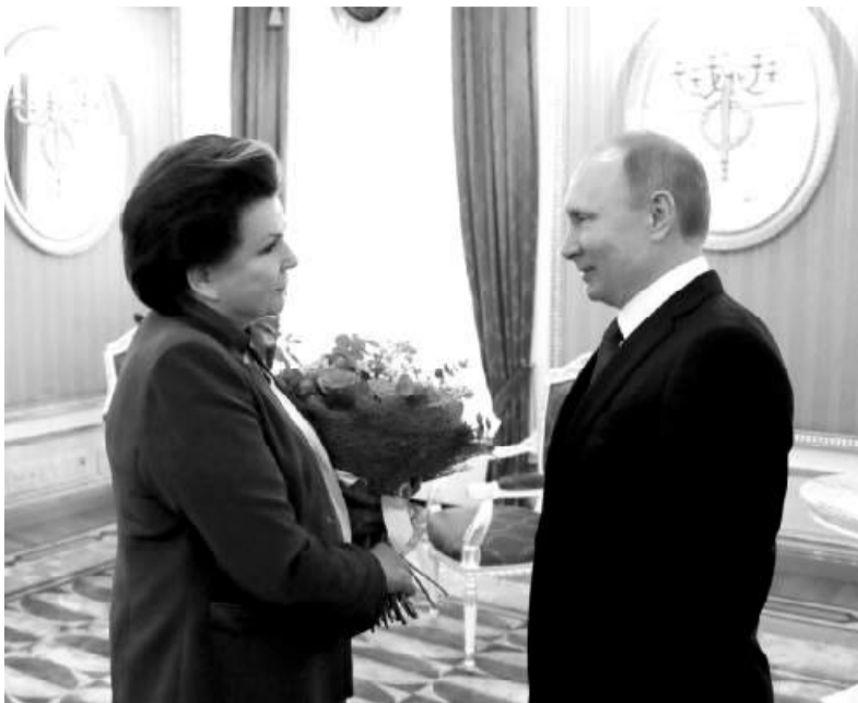
Президент России Владимир Путин поздравляет Валентину Терешкову

Президент России Владимир Путин лично поздравил с юбилеем нашу знаменитую землячку, первую женщину-космонавта, Героя Советского Союза Валентину Терешкову.