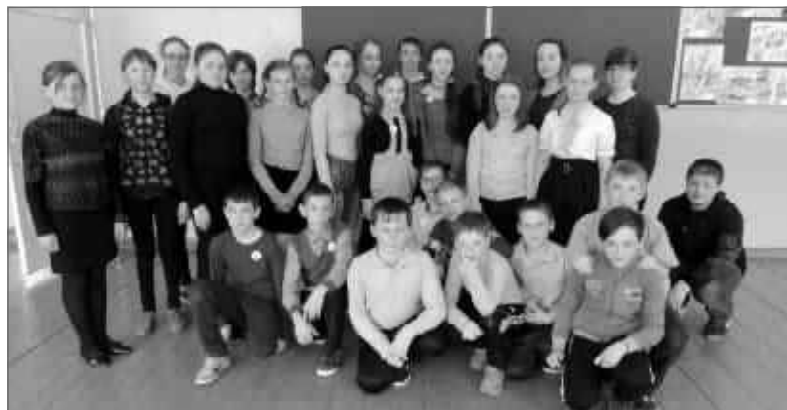
С 3 по 7 апреля на базе Ермаковской средней школы прошли мероприятия, посвященные неделе детской книги «Семь книжных пятниц на неделе»

ятия, посвященные юбилею К. Чуковского, космосу, году экологии), а также областной Акции «Зажирай» к Всемирному дню здоровья, в рамках этой акции проведена информационная акция «Зеленая ленточка», с привлечением волонтеров. При проведении мероприятия использовались различные формы: викторины, квест-игра, интеллектуальная игра, спортивная игра, интерактивная игра. Отличившиеся школьники были награждены призами.