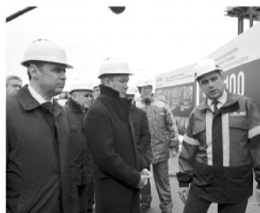
Посетили ОАО «Славнефть-ЯНОС»

– Принимаемая решение о реализации программы «Газпром – детям» на территории Ярославской области, мы конечно, помнили, что Ярославль – город спортивный. И в первую очередь хоккейный, – сказал Алексей Миллер. – Не случайно первый комплекс в программе – со льдом.