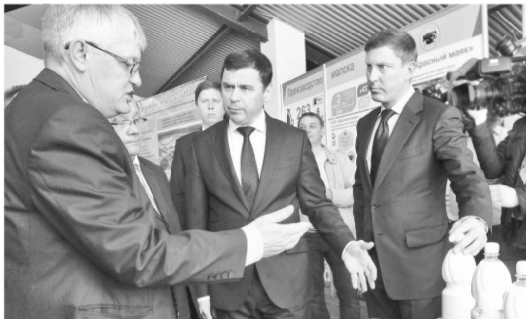
Рабочая поездка главы региона на сельхозпредприятие «Красный маяк»

Новые меры господдержки: упрощённое предоставление сельхозземель инвесторам и субсидии – 2 тысячи рублей за каждый гектар введённой в сельхозоборот земли, – дают первые результаты. Во время рабочей поездки в Ростовский район Дмитрий Миронов побывал в «Агрохолдинге „Истра“». Сельхозпредприятие планирует засеять в этом году 5 тысяч гектаров. В следующем руководству агрохолдинга надеется ввести в оборот 10 тысяч гектаров. Соглашение с новым инвестором было подписано на XVIII Российской агропромышленной выставке «Золотая осень». Она оказалась на редкость урожайной для региона. Правительство Ярославской области подписало договоры с общим объёмом инвестиций порядка 5 млрд рублей, в том числе и в новом направлении – аквакультуре. В частности, Институт агроэкологии и биотехнологии