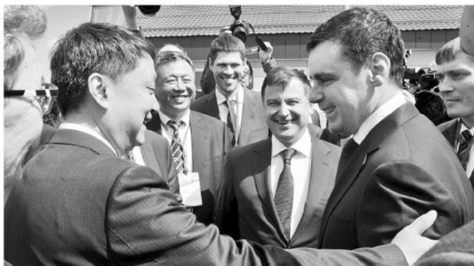
На открытии совместного российско-китайского проекта

В Ярославской области введена в эксплуатацию Хуадянь-Тенинская ТЭЦ. Это крупнейший инвестиционный энергетический проект, реализуемый Китаем в России, ТЭЦ не имеет аналогов в стране. Экономия топлива – природного газа – составит примерно 25 процентов. На треть должны снизиться объёмы выбросов в атмосферу.