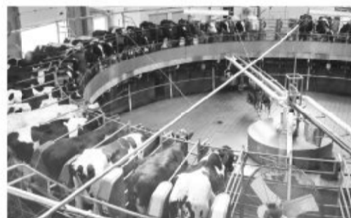
Первая в области доильная установка карусельного типа