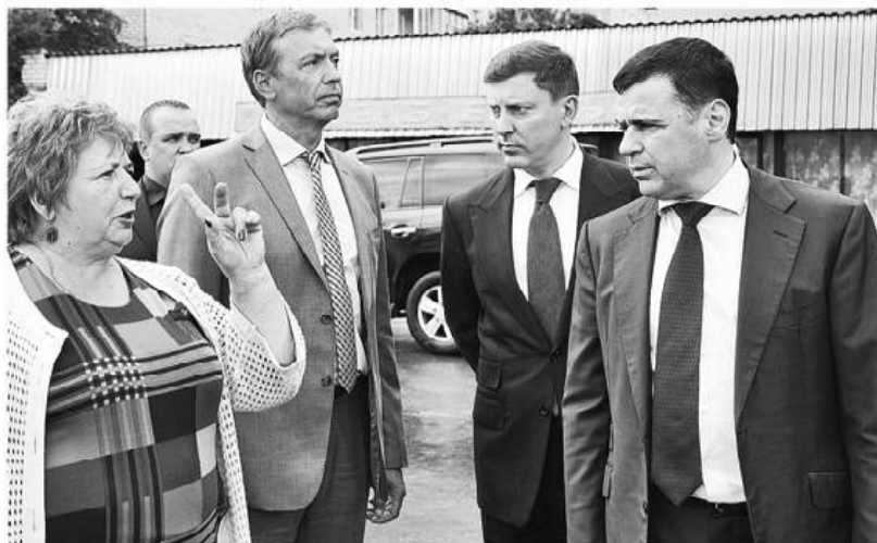
Инспекция ремонта улицы Газовиков в Мышкинском районе

Во время поездок в районы области руководство региона регулярно инспектирует объекты дорожной инфраструктуры. В частности, качество недавнего ремонта на улице Газовиков в Мышкине глава региона Дмитрий Миронов проверил лично. При проведении работ учитывались пожелания жителей по обустройству пешеходных дорожек и установке знаков.