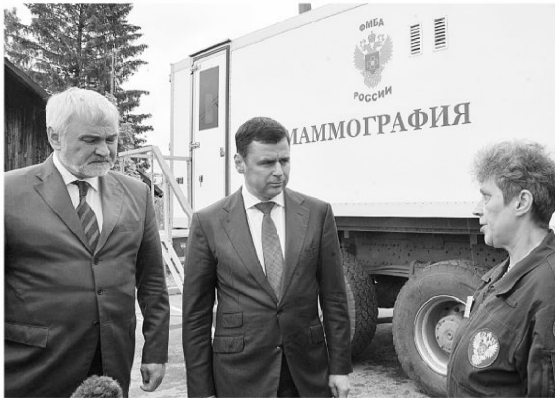
Проект «Мобильная медицина» в Большесельском районе