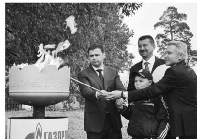
В селе Покров Даниловского района

в Даниловском районе и Бурмакино – Никольское – Сахарез в Некрасовском районе. В высокой степени готовности межпоселковый газопровод высокого давления до деревни Андреевское протяжённостью почти 7 километров и газопровод к деревне Кормилицино.