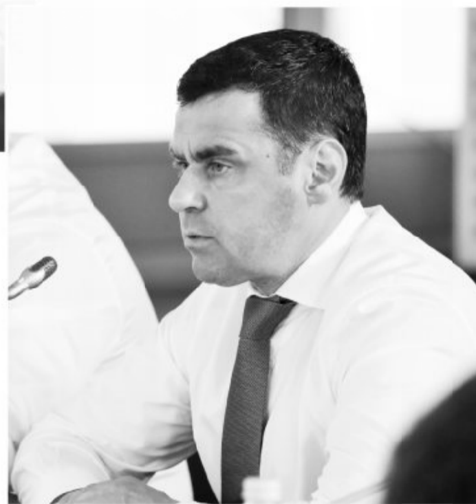
Глава региона Дмитрий Миронов на общероссийском совещании по вопросам сохранения и рационального использования реки Волги

Как отметил глава региона, федеральный проект должен быть реализован с учётом мнения всех заинтересованных регионов, и выступил с инициативой создания рабочей группы, предложив в качестве координатора Ярославскую область.