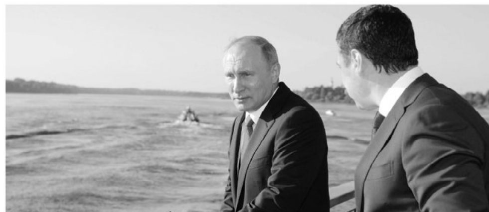
На борту теплохода «Россия»