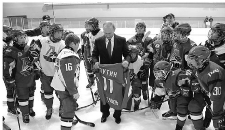
Юные хоккеисты подарили президенту свитер «Локомотива»