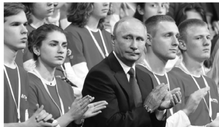
На всероссийском форуме «ПроеКТОрия»

Открытый урок «Россия, устремлённая в будущее» глава государства начал с поздравления с Днём знаний.