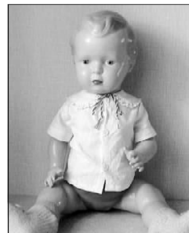
мой старой игрушки ждёт приз. С. СЕРГЕЕВА

Наши дорогие читатели, если у вас хранятся куклы и другие игрушки, приносите их к нам в редакцию с рассказом о том, чья она, как зовут, почему вы её храните? Лучшие истории мы опубликуем, а владельцев са-