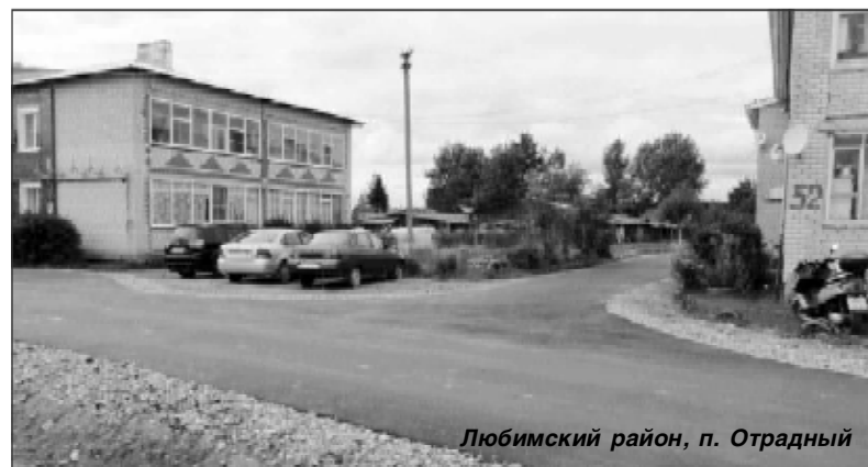
Любимский район, п. Отрядный

Жителям региона, чьи инициативы не вошли в план проекта, несомненно, очень бы хотелось второго «тура» программы. Так и будет!