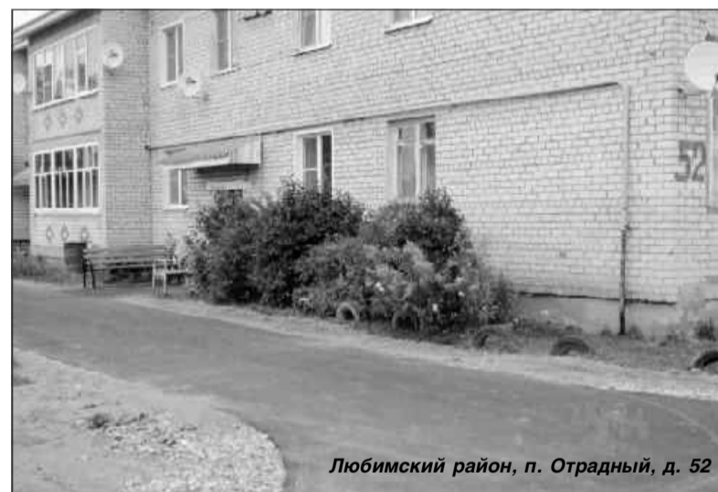
Любимский район, п. Отрядный, д. 52

— Любой может зайти на сайт и узнать, что именно приводится в