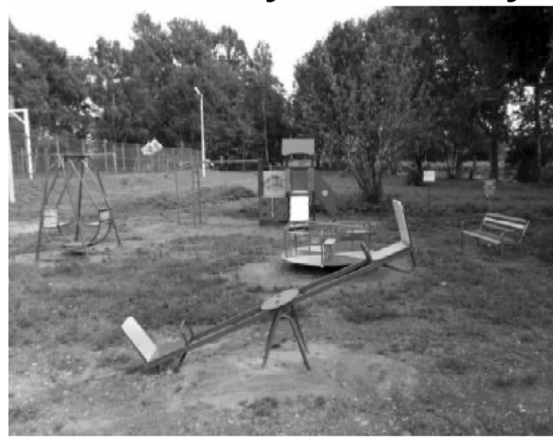
На фото: детская площадка в д. Ермаково Любимского района

Также Дмитрий Миронов отметил важность контроля за качеством работ, подчеркнув, что расчет на инициативность граждан при реализации проекта себя полностью оправдал. Люди активно следят за обустройством