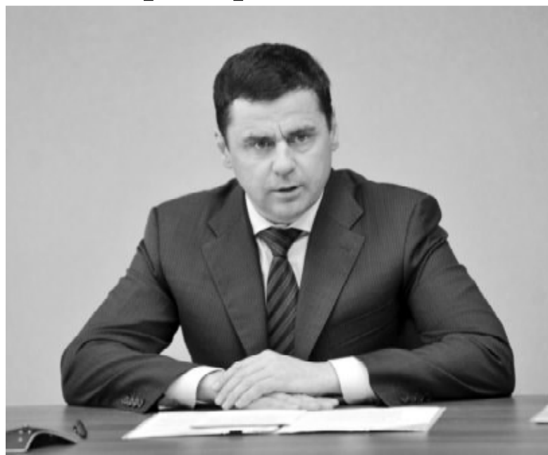
– Это системная ошибка, и пора уже вопрос решить, – подчеркнул глава региона. – Надо посмотреть, насколько эффек-

Дмитрий Миронов взял вопрос под контроль и поручил Правительству области провести анализ всех проектных организаций, работающих над подготовкой документации для капитального ремонта многоквартирных домов.