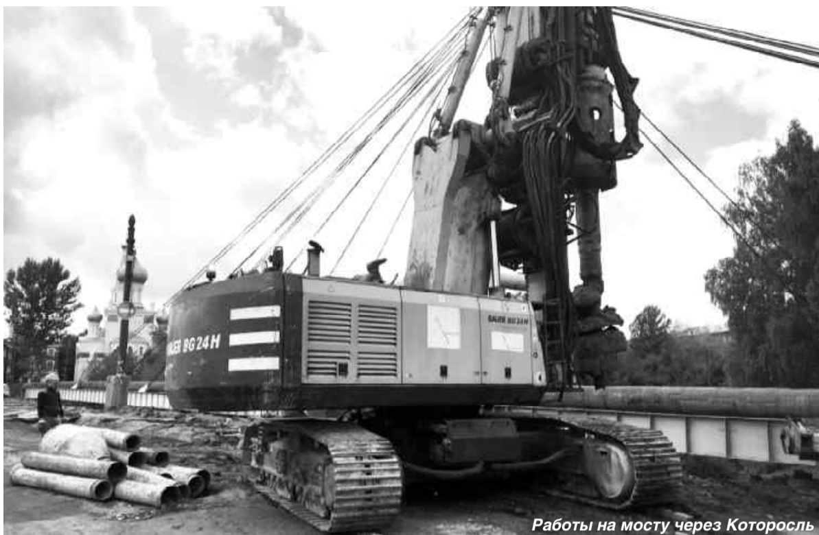
Работы на мосту через Которосль

Поступления из федеральных источников в следующем году прогнозируются в объеме более 4 млрд руб. Это также отражено в проекте закона «Об