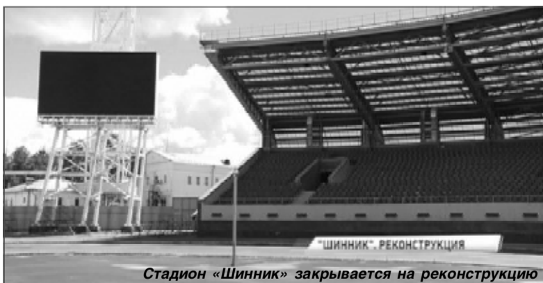
Стадион «Шинник» закрывается на реконструкцию

На развитие дорожного хозяйства и транспорта из бюджета региона будет направлено более 5,3 млрд руб. Продолжится реализация приоритетного федерального проекта «Безопасные и качественные дороги»: по программе комплексно-развития транспортной инф-