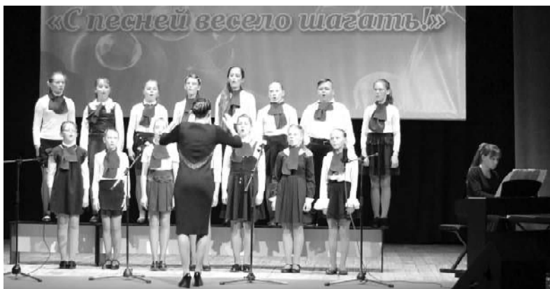
19 МАЯ В ДЕТСКОЙ МУЗЫКАЛЬНОЙ ШКОЛЕ П. ПРЕЧИСТОЕ СОСТОЯЛСЯ II МЕЖМУНИЦИПАЛЬНЫЙ ФЕСТИВАЛЬ ДЕТСКИХ ХОРОВЫХ КОЛЛЕКТИВОВ «С ПЕСНЕЙ ВЕСЕЛО ШАГАТЬ».