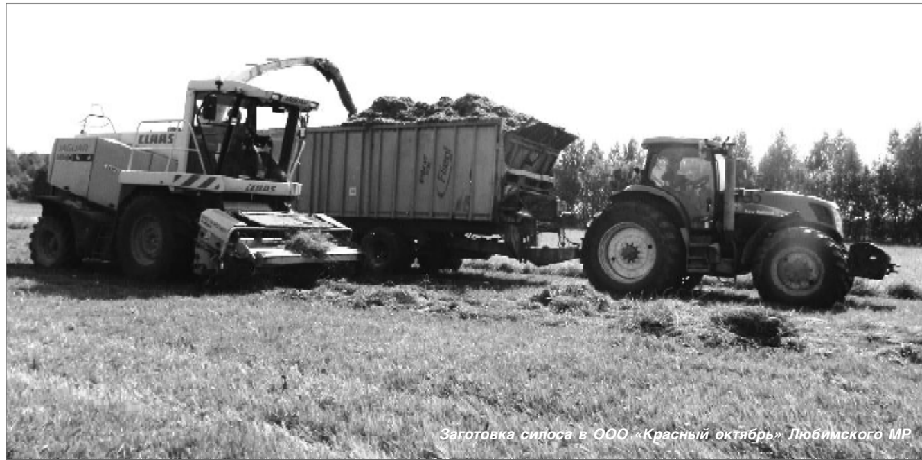
Заготовка силоса в ООО «Красный октябрь» Любимского МР

Кроме того, на 1 января 2016 года общая площадь земель сельскохозяйственного назначения не превышала третьей части фонда области. Глава региона дал поручение вспахать не менее 40 тысяч гектаров заброшенных земель. В 2017 году задачу удалось перевыполнить – в оборот возвращено свыше 45 тысяч гектаров пашни, пастбищ и сенокосов. В нынешнем году это даст прибавку в производстве зерновых и кормовых культур, картофеля, овощей и продукции животноводства.