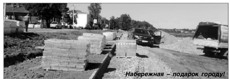
Набережная - подарок городу!