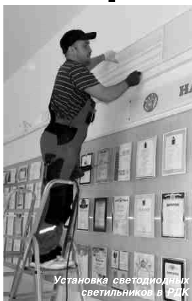
Установка светодиодных светильников в РДК