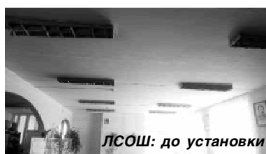
ЛСОШ: до установки