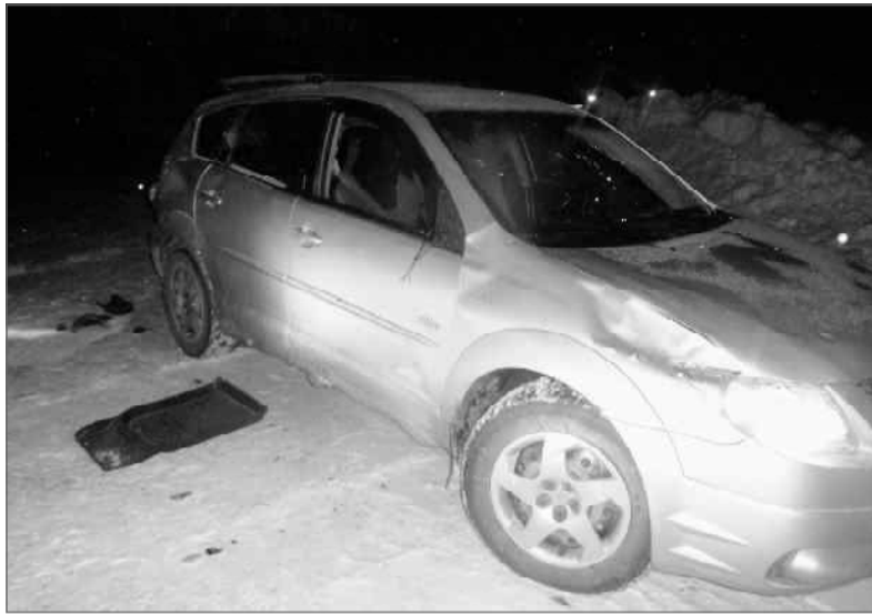
«Понтиак», совершил столкновение с находившимся на проезжей части дороги лосем. В результате метила остановившийся на обочине проезжей части для ремонта грузовик МАЗ и совершила с

Информация о фестивале и форма заявки размещена на сайте http://любим-район.рф/lyubimskoe-usznit-1.html