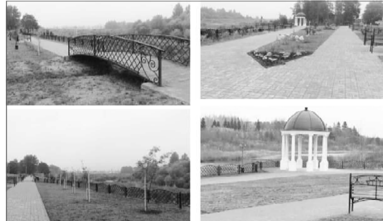
Дворик дома № 70 улица Даниловская