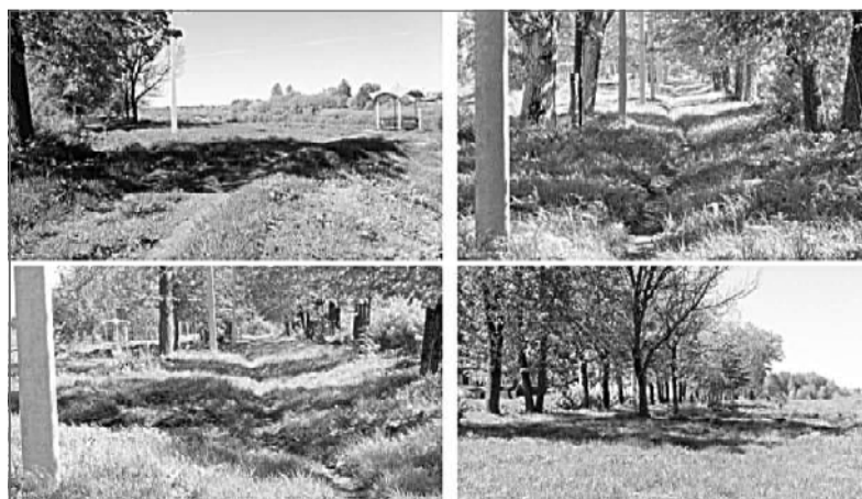
Придомовая территория п. Отрадный, д. 13,14