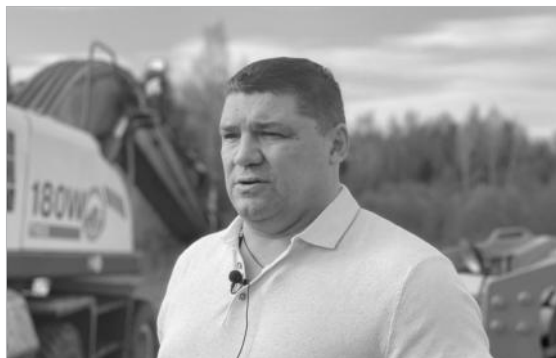
Депутат Госдумы Андрей Коваленко на открытии отремонтированной дороги в Ярославской области

«Во время поездок по районам области я общаюсь с местными жителями, которые часто жалуются на состояние дорог. Все их пожелания мы собираем и передаём в соответствующие инстанции. Важно максимально учитывать эти пожелания при составлении планов по ремонту и строи-