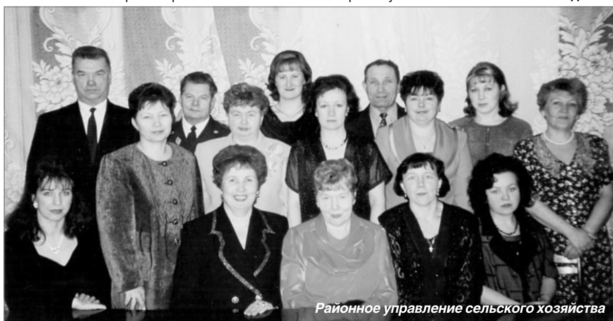
Районное управление сельского хозяйства