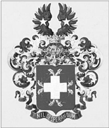
Фамильный герб Зиссерманов

Вокруг истории Бужениновского замка много легенд. По одной из них, построивший в 1910 г., замок отставной полковник казачьих войск Павел Арнольдович Фон Зиссерман, был далеким потомком магистра Фюрстенберга.